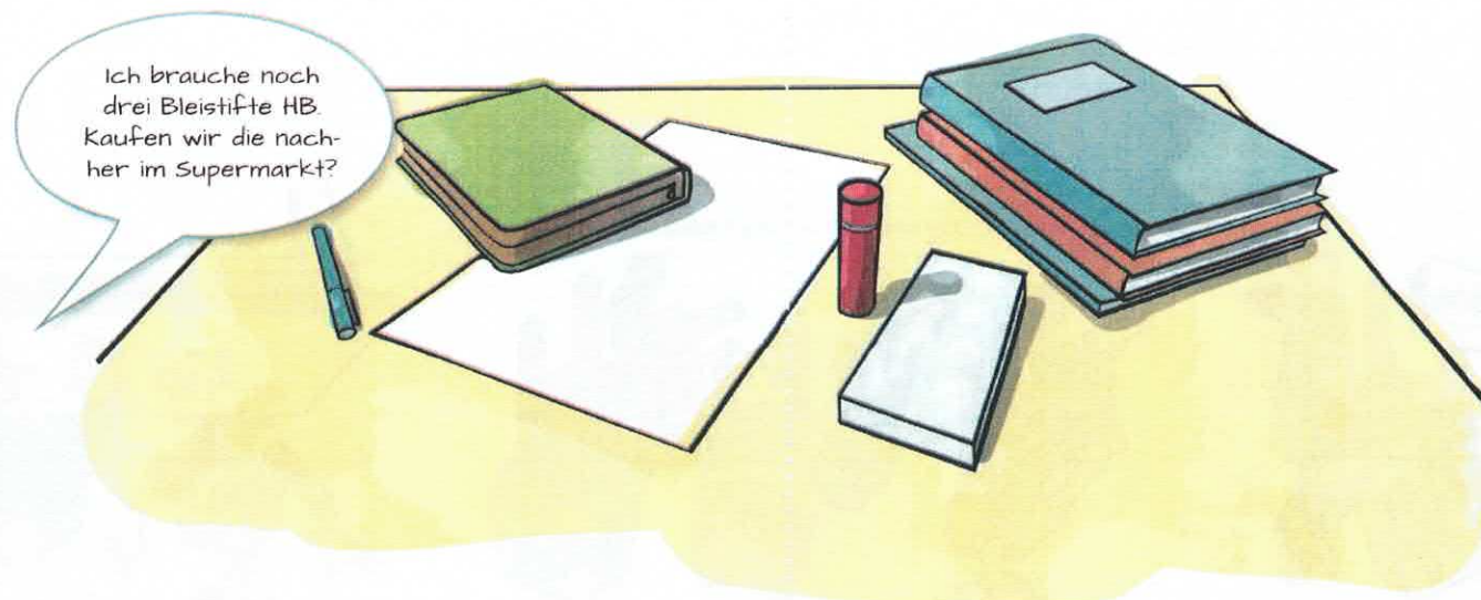
Tipp 4: Die nötigen Schulmaterialien beschaffen und bei Bedarf erneuern