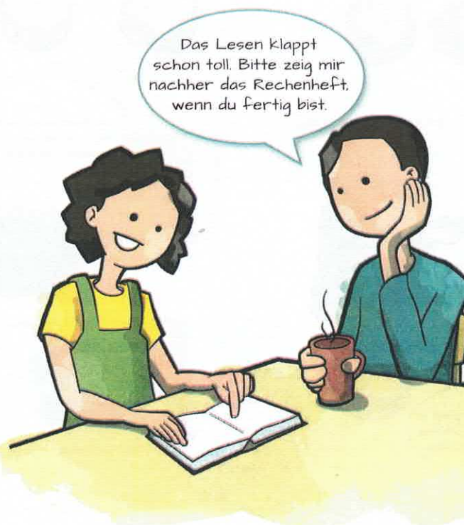
Tipp 3: Kontrollieren, ob die Hausaufgaben gemacht sind, und bei Bedarf helfen