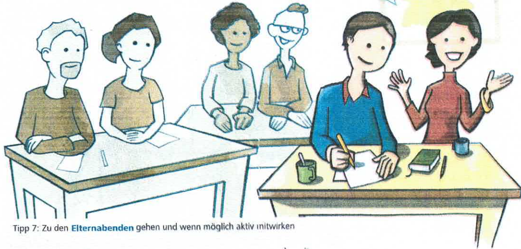
Tipp 7: Zu den Elternabenden gehen und wenn möglich aktiv mitwirken