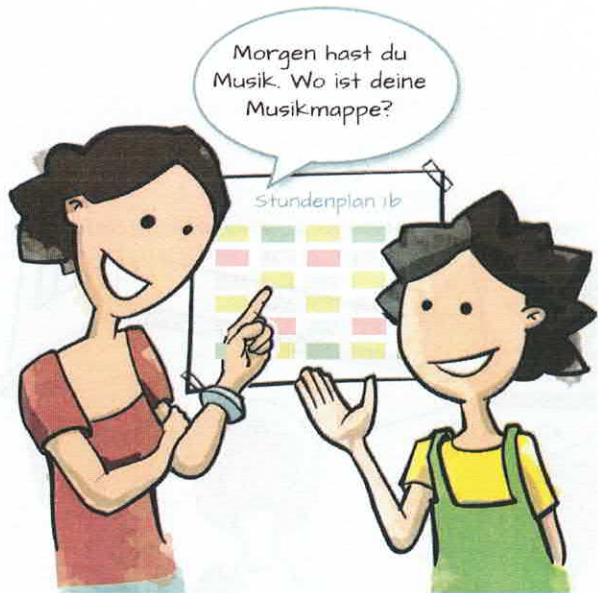
Tipp 1: Auf den Stundenplan schauen und dabei auf die Fächer achten