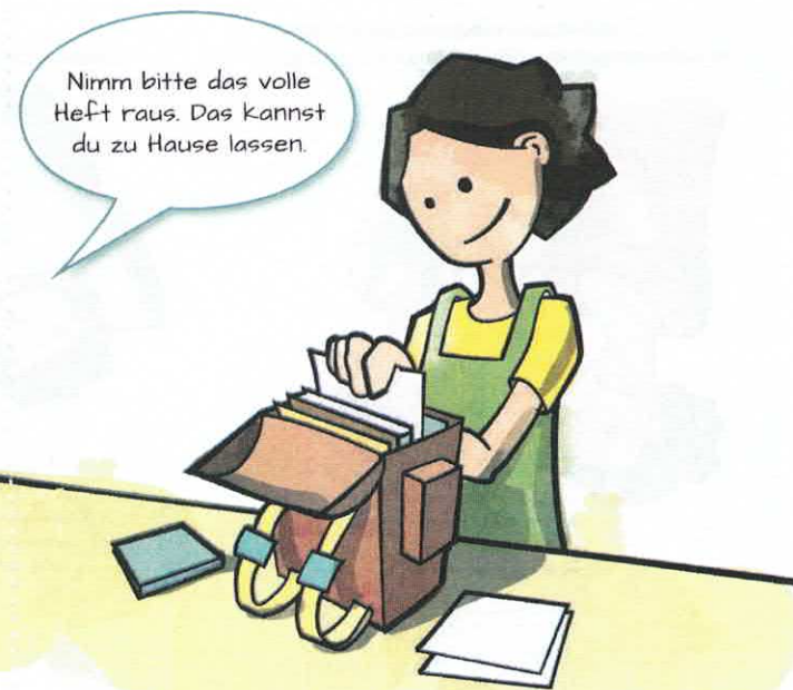
Tipp 5: Den Schulranzen mit dem Kind in Ordnung halten