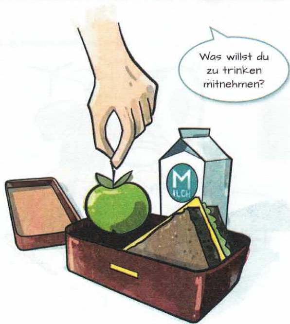
Tipp 2: Gesundes Essen und Getränke für die Pause mitgeben