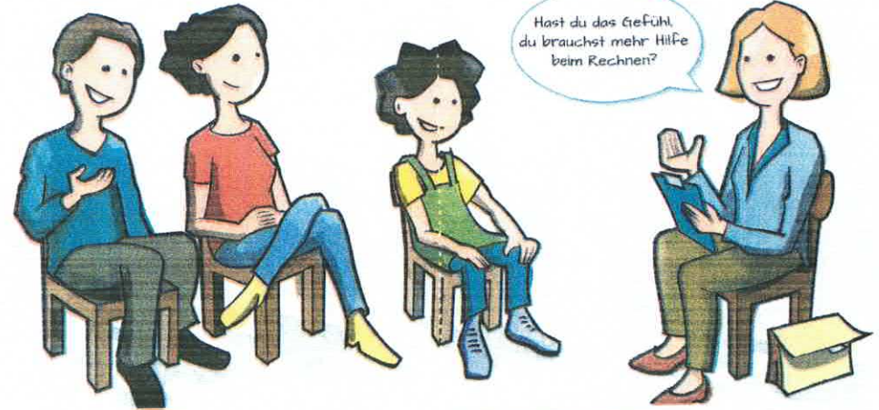
Tipp 10: Nach Mitteilungen der Schule fragen, sie lesen und Aufforderungen nachkommen

Hast du das Gefühl, du brauchst mehr Hilfe beim Rechnen?